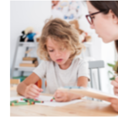
Klinische kinder- en jeugdpsychologie Variabel startmoment