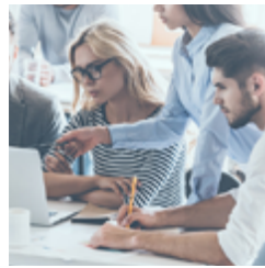
Levensloopspsychologie Start kwartiel 2