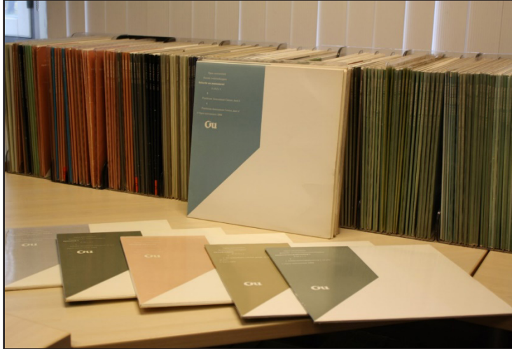
De in het depot bewaarde beeldplaten met onderwijsmateriaal

Daarnaast vindt de werkgroep het belangrijk om herinneringen van (oud-)medewerkers die niet in officiële documenten te vinden zijn te 'bewaren'. Een gangbare methode hiervoor in historisch onderzoek is oral history . De Werkgroep ambieert een oral history project te starten, eventueel in de vorm van een stageopdracht. Mogelijkheden hiertoe zullen met de faculteit Cultuurwetenschappen worden besproken. In 2022 werd wat dit betreft geen substantiële voortgang geboekt.