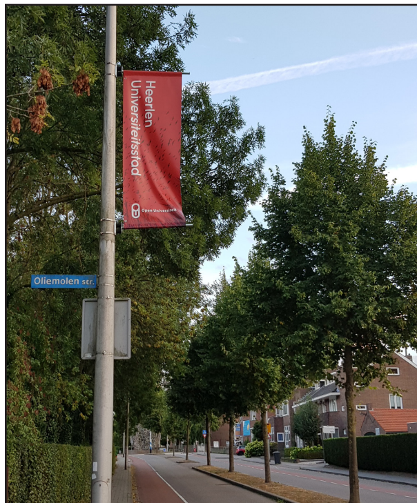
Vlag 'Heerlen universiteitsstad' bij het Maankwartier