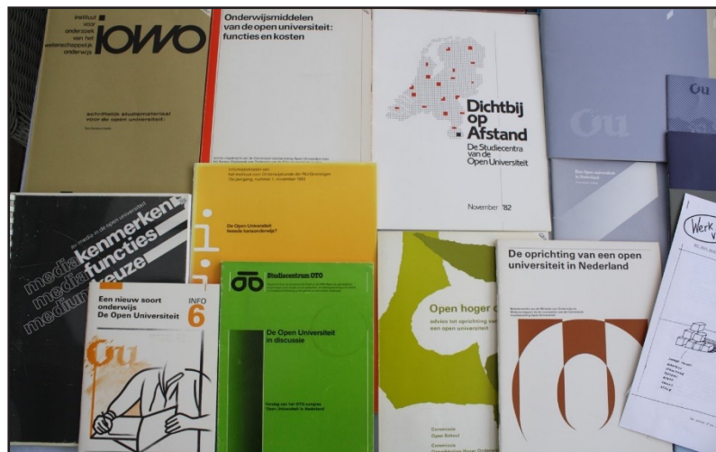
Documentatie over de oprichting van de Open Universiteit in het depot

In het afgelopen decennium is binnen de Open Universiteit zowel het enthousiasme voor als de daadwerkelijke activiteiten op het gebied van de kunst en het erfgoed toegenomen. Nadat er in 2013 in gebouw Athabasca een ruimte beschikbaar kwam die als erfgoeddepot ging dienen, is er veel historisch materiaal verzameld en werd er vaker dan voorheen aandacht aan de geschiedenis geschonken. Deze aanloop resulteerde in de oprichting van een werkgroep Kunst en Erfgoed en de aanstelling van een conservator kunst & erfgoed voor 0,2 fte in september 2020 (en een materieel budget van € 1.000) bij de afdeling Academische Zaken.